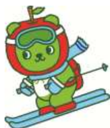
長野県観光PRキャラクター 「アルクマ」